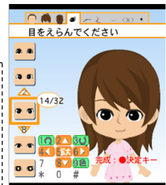
↑ アバター作成画面