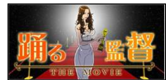
↑タイトルイメージ

http://www.drecom.co.jp/pr/release/20100921_2