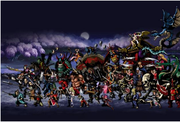
100 種以上のキャラクター