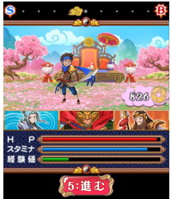
ミッション画面イメージ