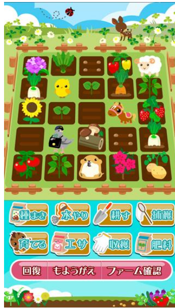
ファームイメージ