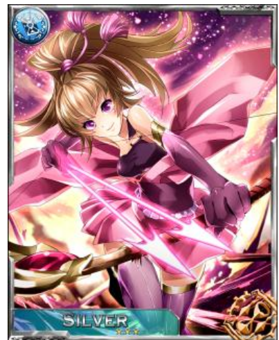
カードイラストイメージ