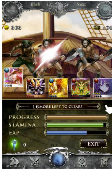
クエスト画面イメージ