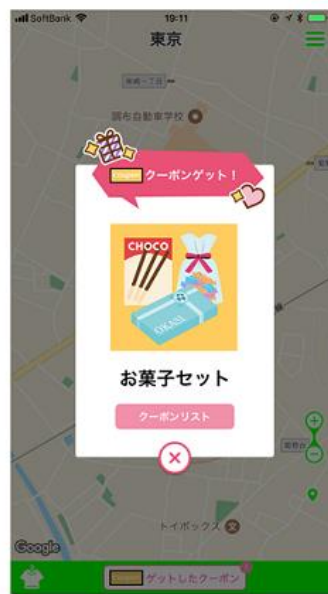
地図に落ちているたまごに近づいて割る (タップする) と、クーポンを獲得できます。