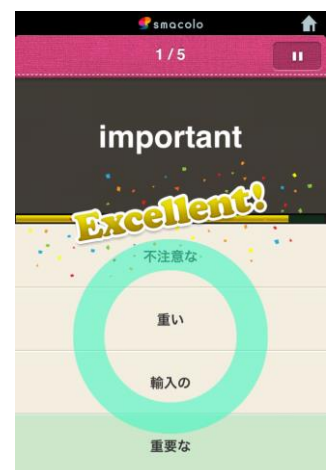
↑「えいぼんたん」学習画面

ソーシャルラーニングの各タイトルいずれもApp Store上で好評をいただいております。App Store内教育カテゴリのトップ無料ランキング1位に『えいぼんたん』、10位内に他2タイトル全てがランクインしております。(2013年6月24日現在)ドリコムでは、ソーシャルラーニングを通じて学習の機会を広げ、継続して学習し続けられる環境作りに貢献してまいります。