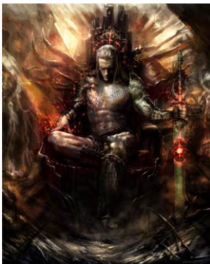
↑バイガス ザ ソード (Beigas the Sword)