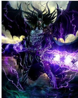
↑デスナイト (Death Knight)