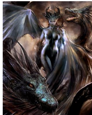
↑ミゼラ ザ リネージュ (Misera the Lineage)